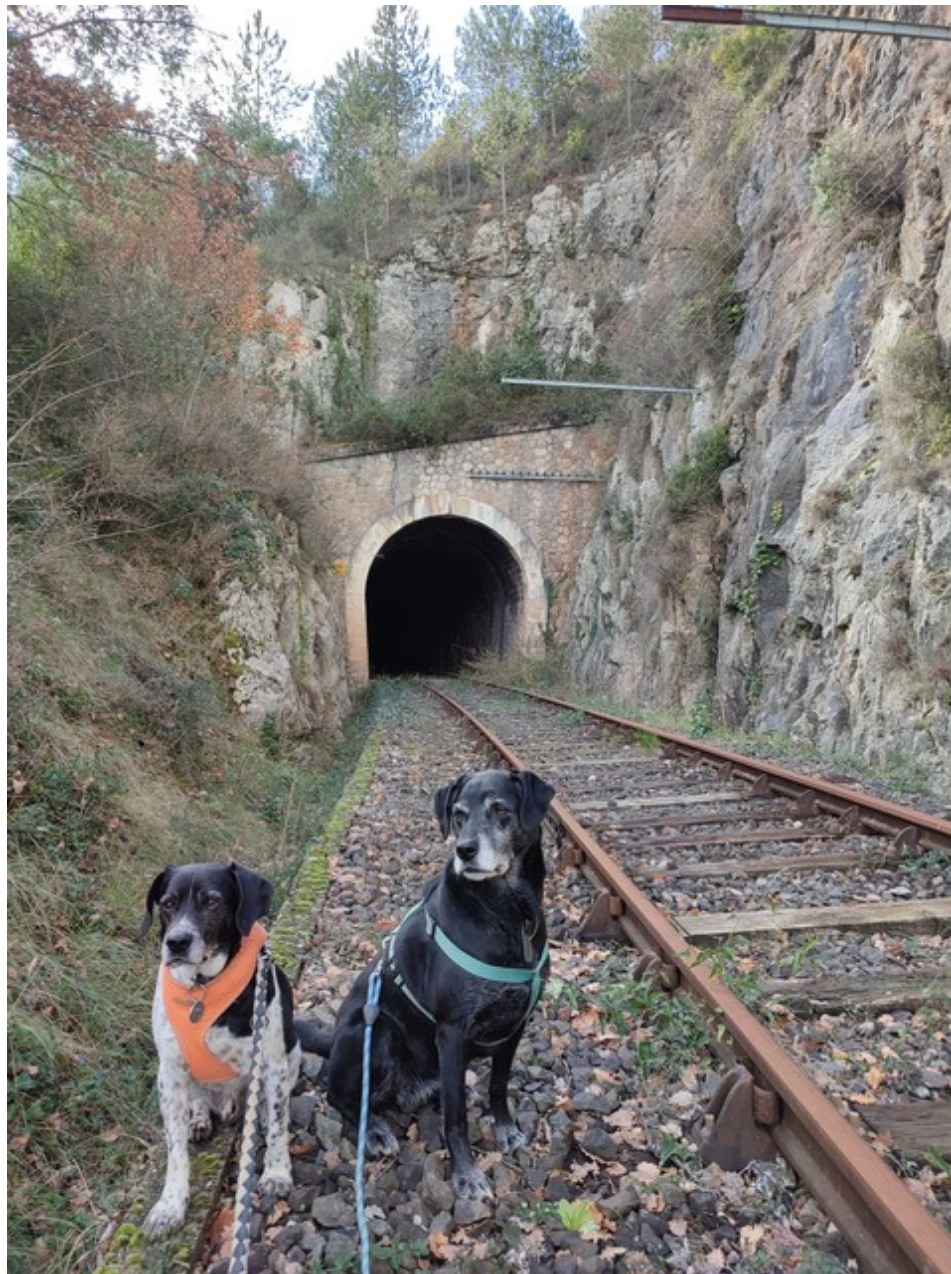
L'entrée est bien surveillée ! (29/01/2023)