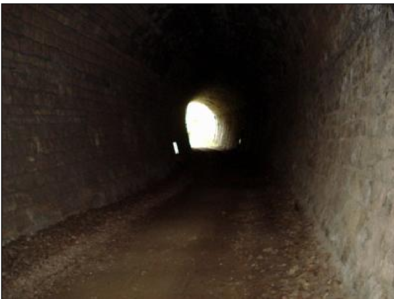
Bel exemple de dissymétrie apparente due à la courbe du tunnel

Si cette fiche comporte des erreurs ou des oublis, merci de nous le signaler.