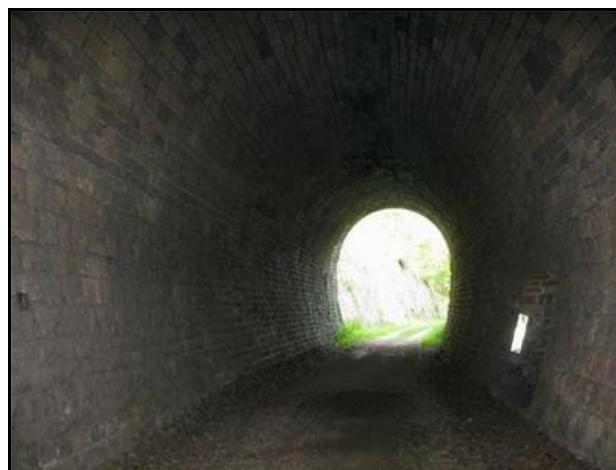
L'entrée et la sortie, vues du milieu de la galerie