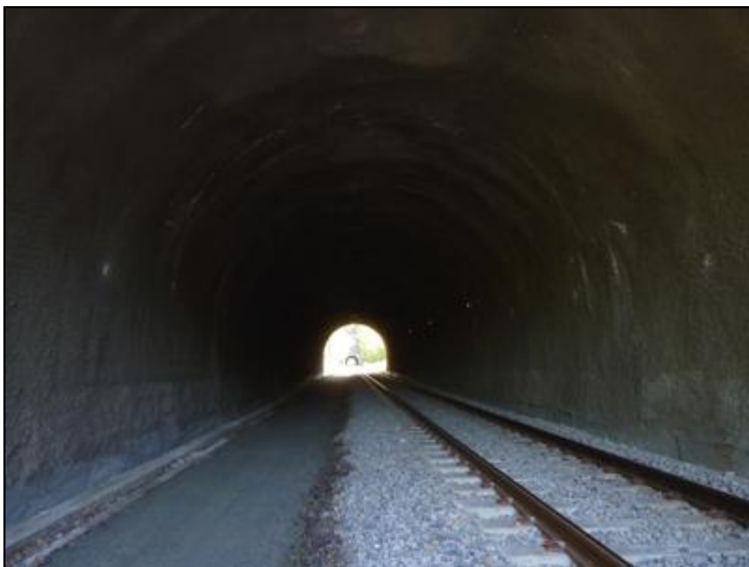
Au fond, la sortie du tunnel de Caylou

Si cette fiche comporte des erreurs ou des oublis, merci de nous le signaler.