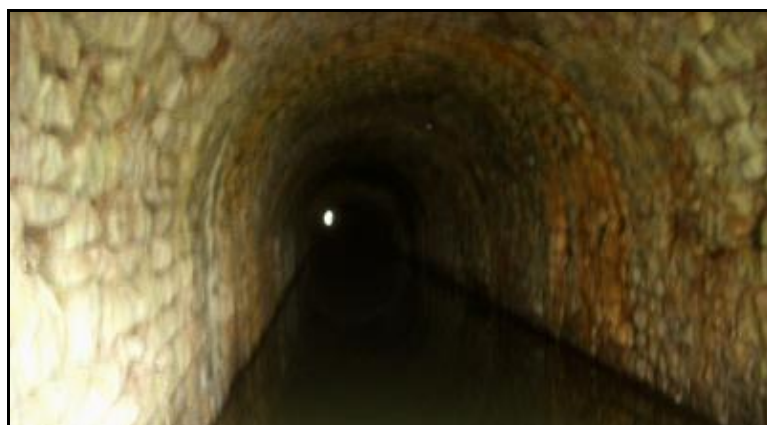
La galerie inondée

Si cette fiche comporte des erreurs ou des oublis, merci de nous le signaler.