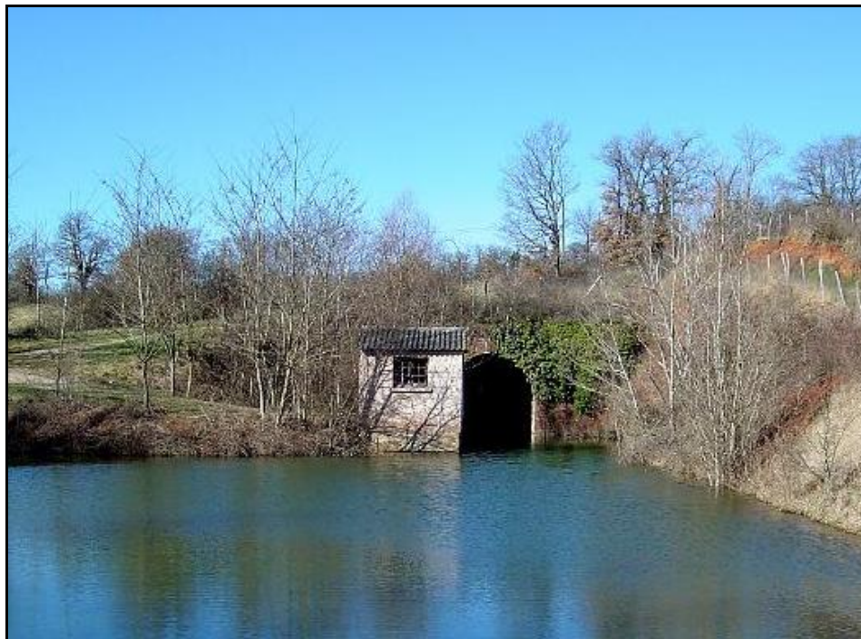
La sortie du tunnel dans l'étang