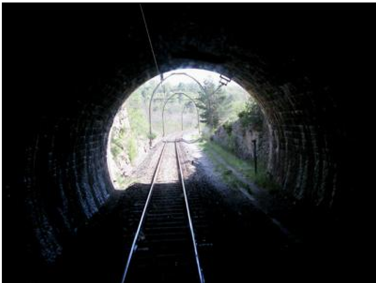
Ci-dessus et ci-dessous, la sortie du tunnel vue de l'intérieur