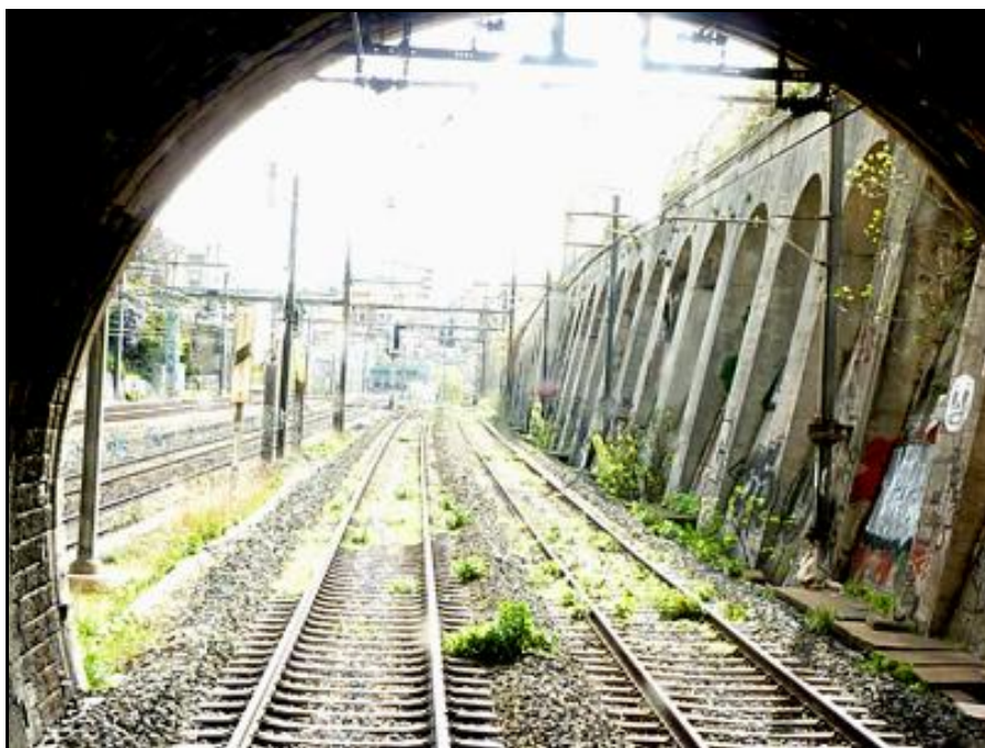
La sortie du tunnel vue depuis l'intérieur

Si cette fiche comporte des erreurs ou des oublis, merci de nous le signaler.