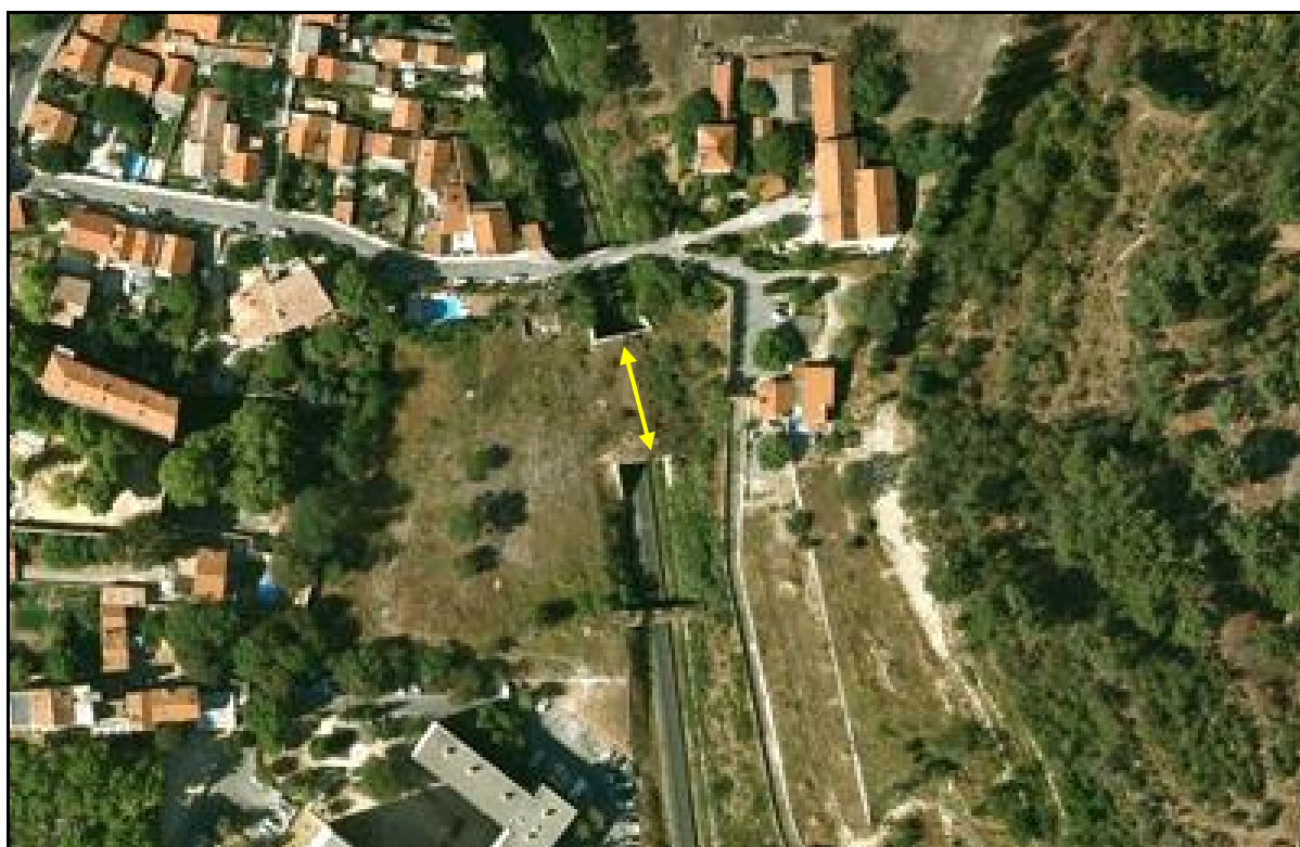
Vue aérienne de la galerie

Si cette fiche comporte des erreurs ou des oublis, merci de nous le signaler.