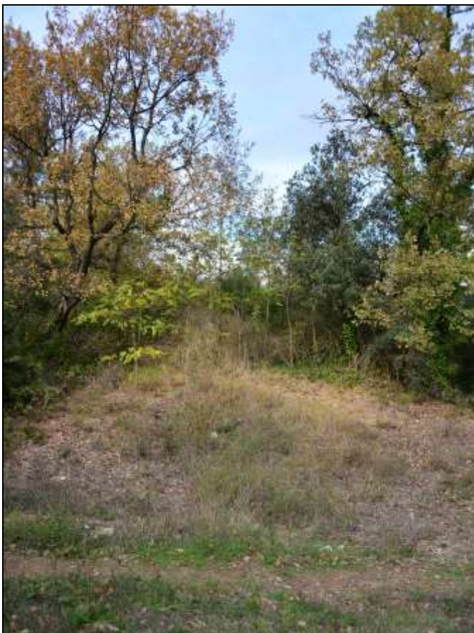
Ce qu'il reste de la sortie du tunnel en 2013.

Si cette fiche comporte des erreurs ou des oublis, merci de nous le signaler.