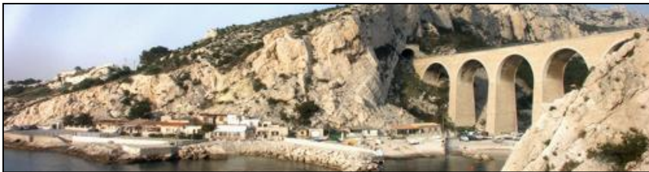
La calanque et le viaduc de la Vesse avec la sortie du tunnel de Niolon

Si cette fiche comporte des erreurs ou des oublis, merci de nous le signaler.