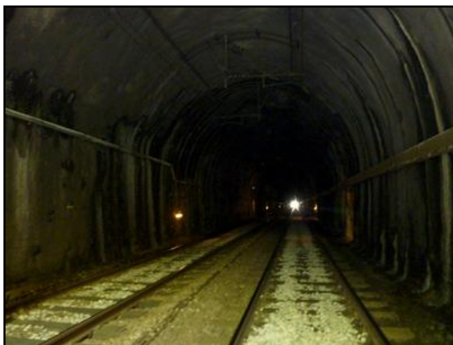
Ci-dessus et ci-dessous, la galerie du tunnel Sur les deux photos ci-dessous, au fond, le tunnel de La Motte qui précède celui de la Houblonnière