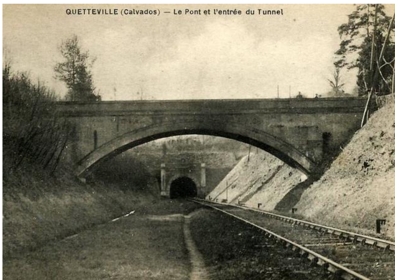
Photo ancienne de l'entrée du tunnel