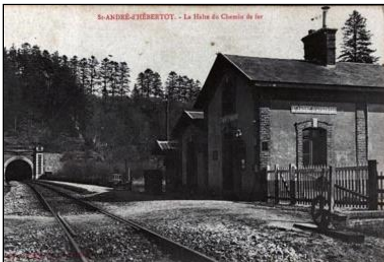
Ci-dessus, vue ancienne de la sortie