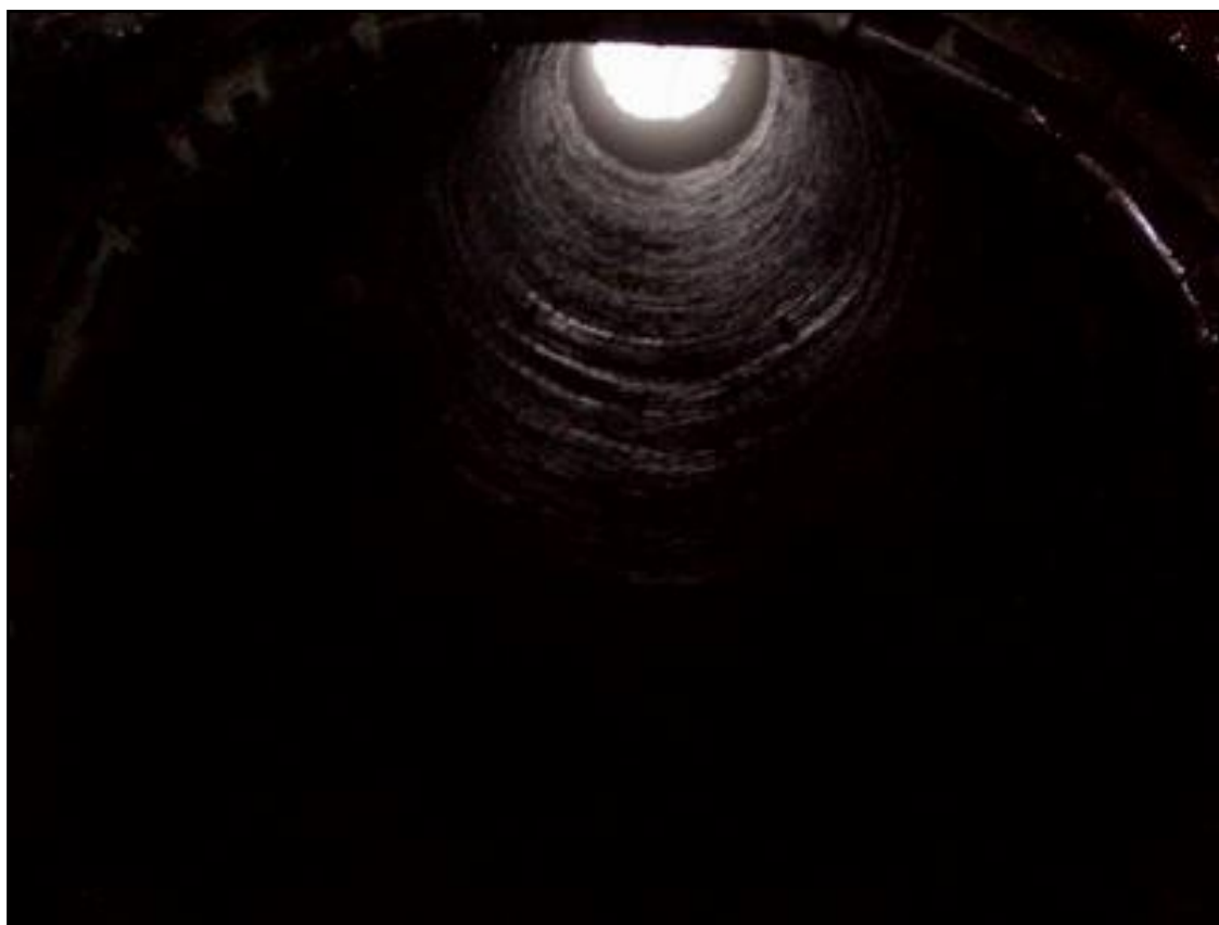
L'une des cheminées d'aération vue depuis le souterrain