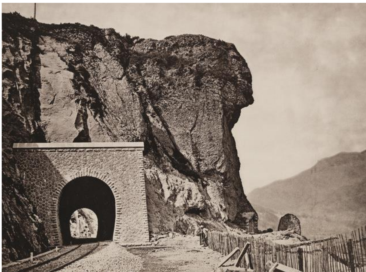
Le tunnel peu après son achèvement