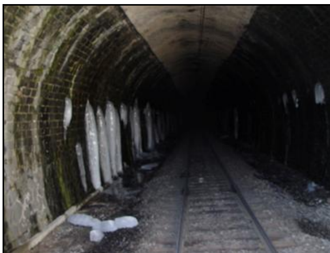
Ci-dessus et ci-dessous, effets spectaculaires des infiltrations et du gel hivernal