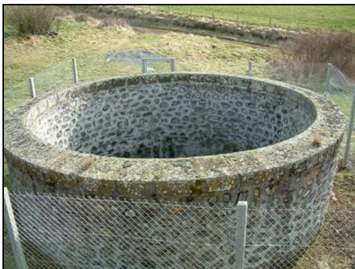
Gros plan sur l'ouverture de la cheminée nord d'une quinzaine de mètres de profondeur jusqu'à la voûte du tunnel