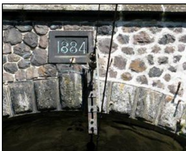
Un âge vénérable

Si cette fiche comporte des erreurs ou des oublis, merci de nous le signaler.