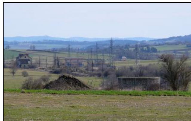
La cheminée nord, côté entrée