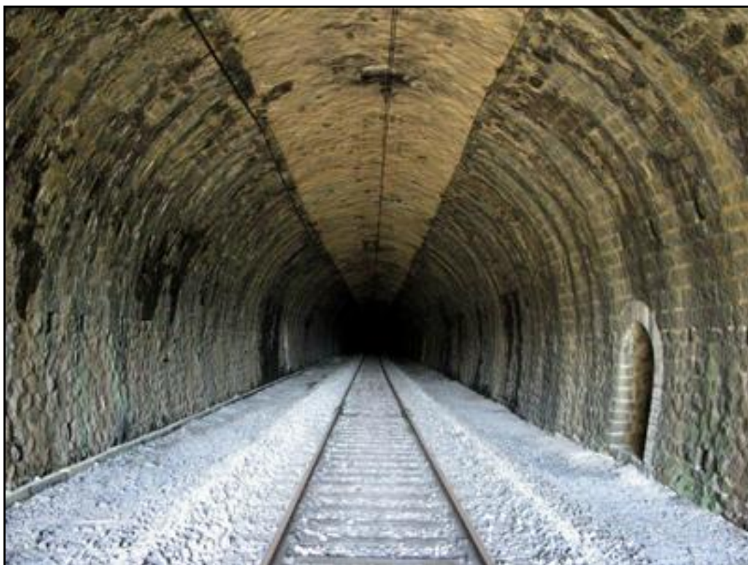
La superbe galerie du tunnel