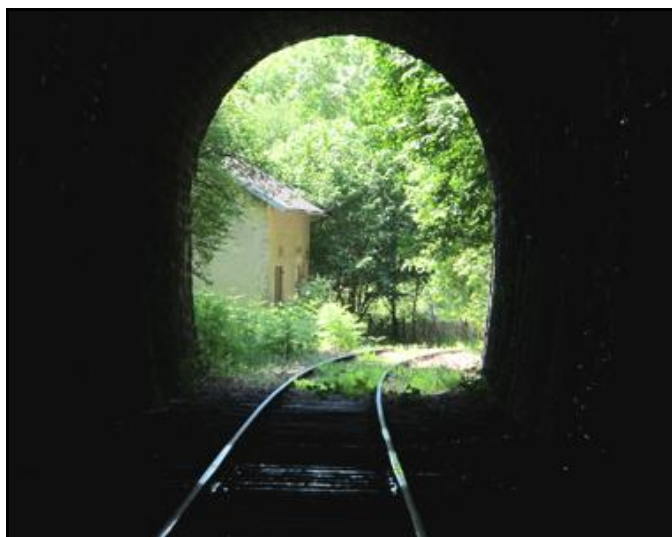
A la sortie du tunnel, l'ancienne maison cantonnière de Roc de Lennes