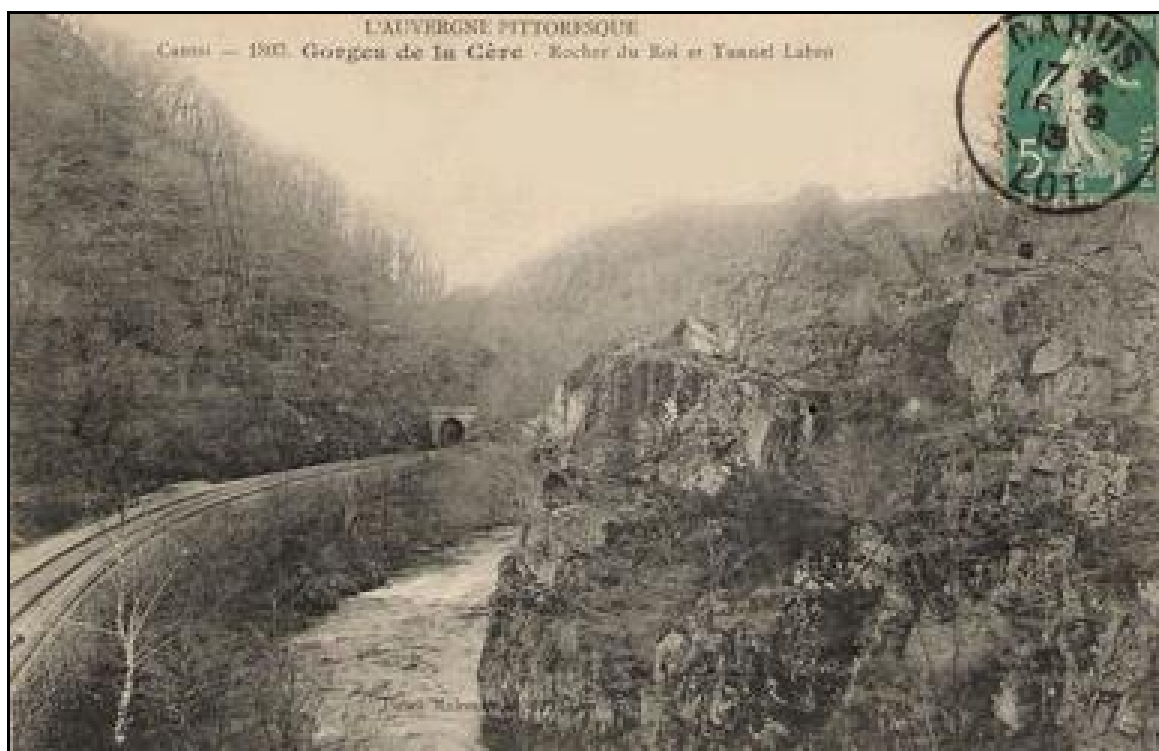
Vue ancienne du tunnel et du Rocher du Roi

Si cette fiche comporte des erreurs ou des oublis, merci de nous le signaler.