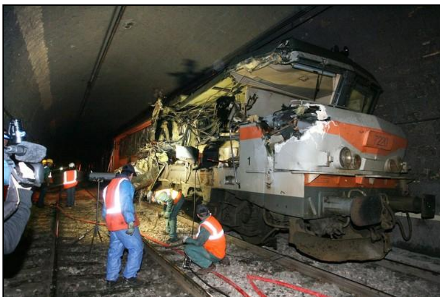
Les secours s'activent autour de la machiné éventrée

A noter que le tunnel du Livernant fait à juste titre l'objet d'exercices de secours réguliers. Ces accidents en démontrent l'utilité.