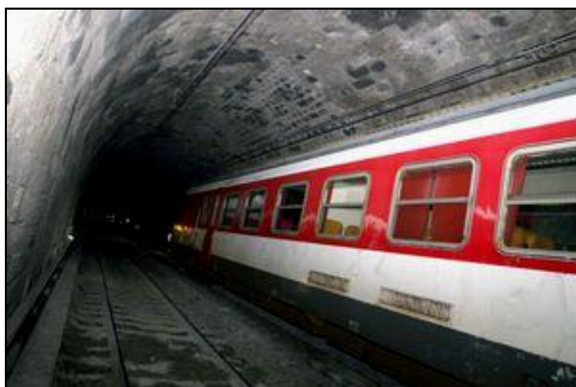
Photo d'un exercice de secours dans la galerie du tunnel du Livernant

A noter que le tunnel du Livernant fait à juste titre l'objet d'exercices de secours réguliers. Ces accidents en démontrent l'utilité.