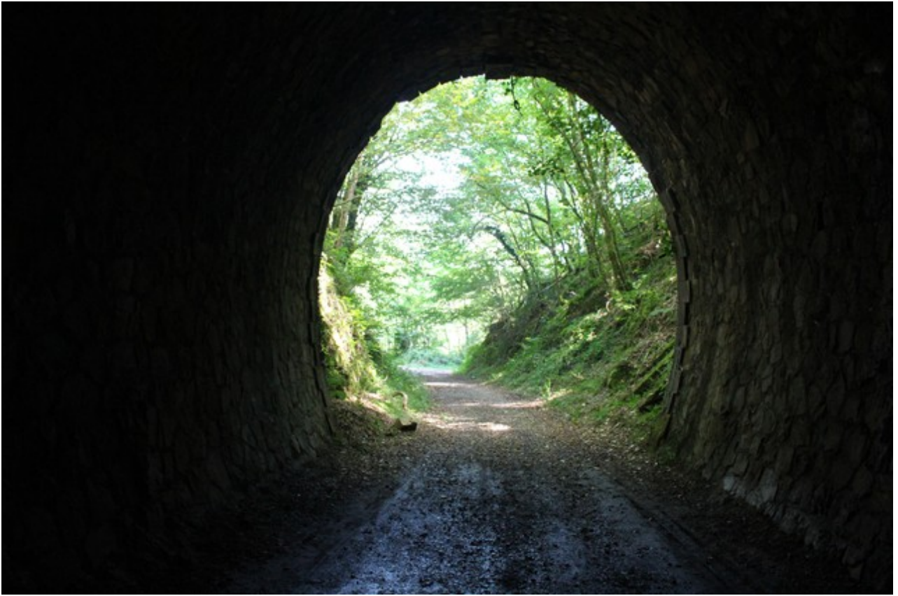
Vue vers la sortie (16/08/2024)