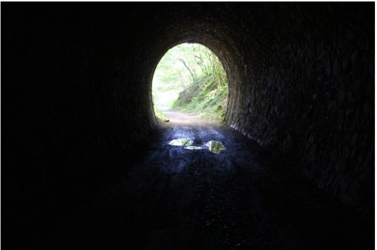
Vue vers la sortie (16/08/2024)