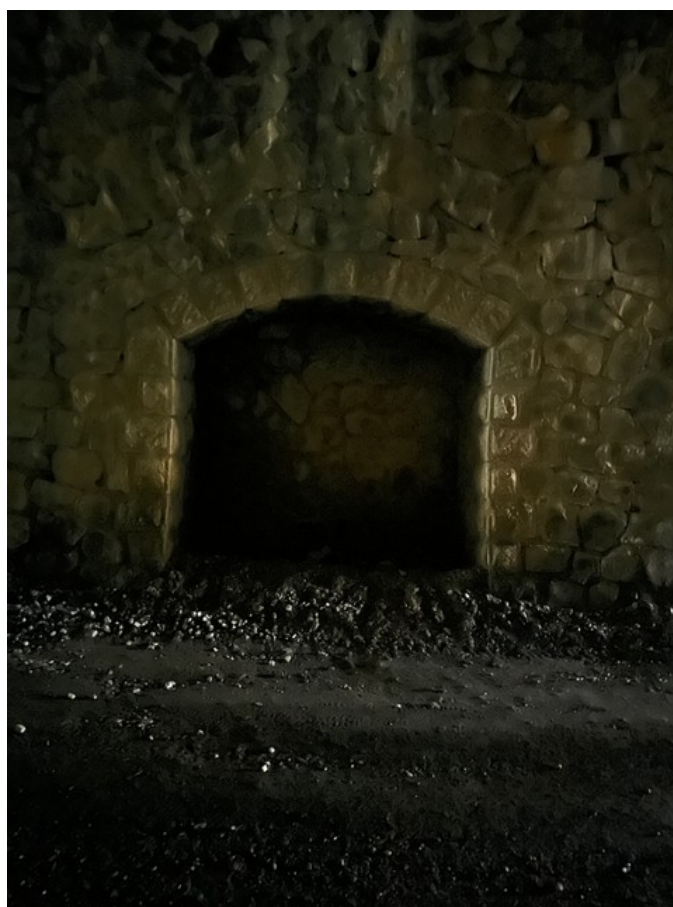
Vue d'une niche (16/08/2024)