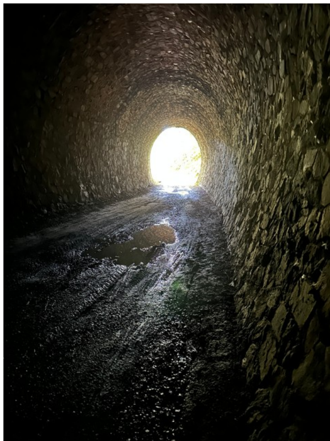
A gauche, vue vers l'entrée (16/08/2024) ; à droite, vue vers la sortie (16/08/2024)