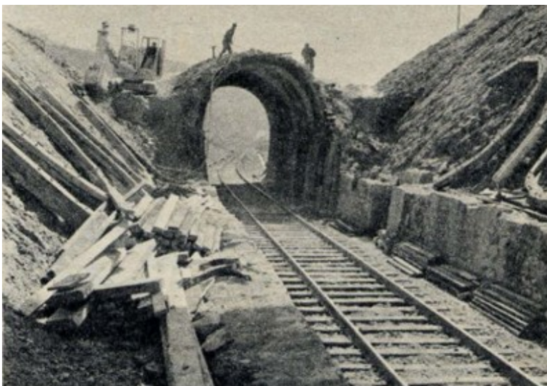
Destruction du tunnel et enlèvement des cintres métalliques posés en 1951

Si cette fiche comporte des erreurs ou des oublis, merci de nous le signaler. Envoyez-nous vos photographies et documents pour la compléter.