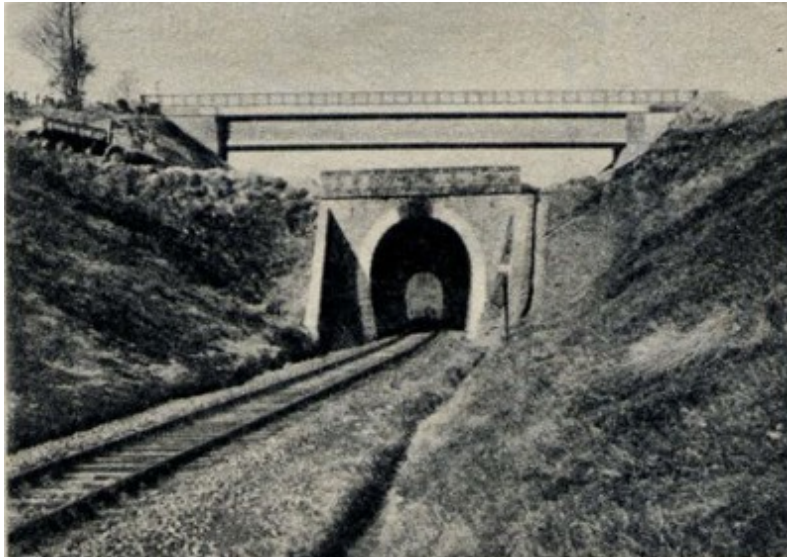
Sortie du tunnel peu de temps avant sa destruction