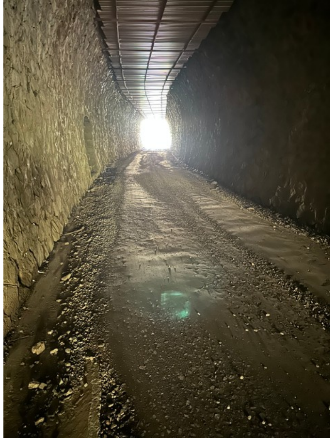
Vues vers l'entrée