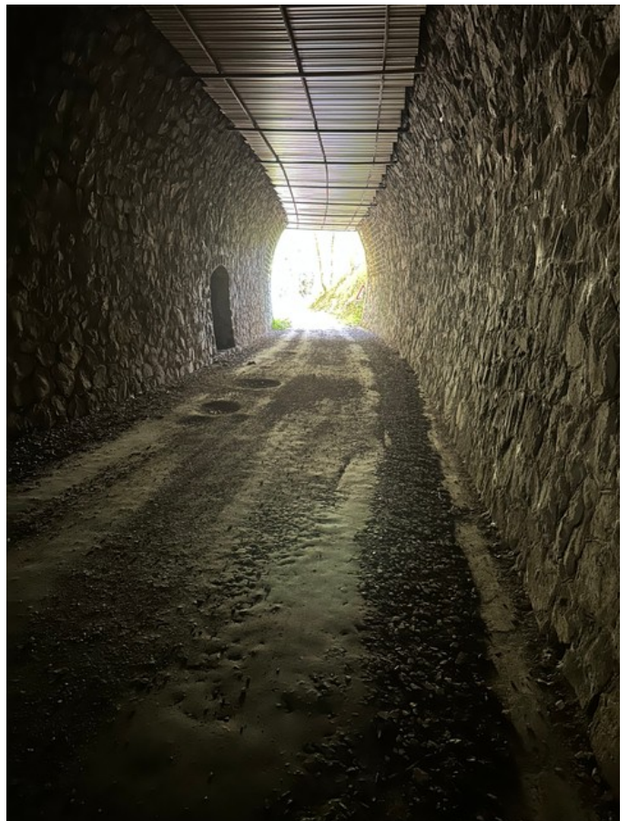
Vues vers la sortie