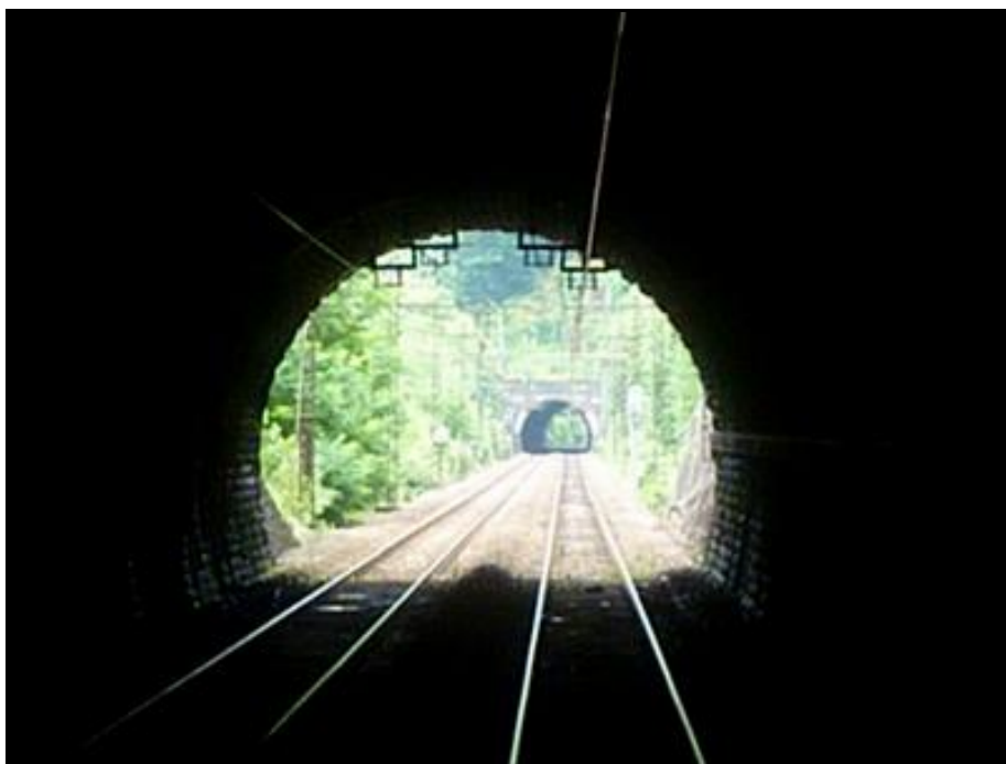
La sortie du tunnel vue de l'intérieur avec, au fond, le tunnel du Pouch

Si cette fiche comporte des erreurs ou des oublis, merci de nous le signaler.