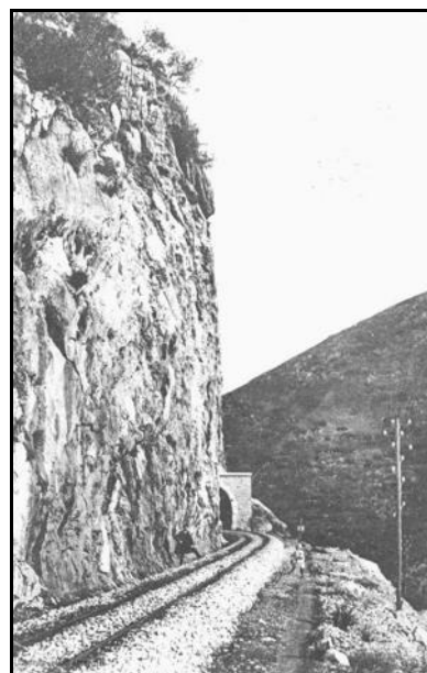
Deux autres vues de l'entrée et de la sortie du tunnel