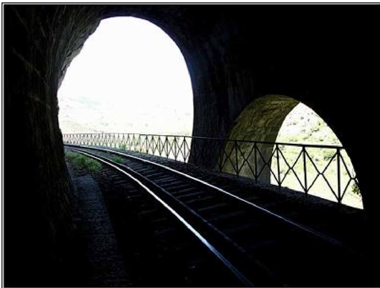
L'entrée du tunnel vue depuis l'intérieur de sa casquette de protection

Si cette fiche comporte des erreurs ou des oublis, merci de nous le signaler.