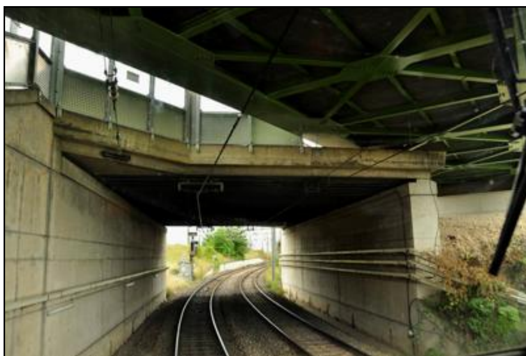
La galerie du saut de mouton