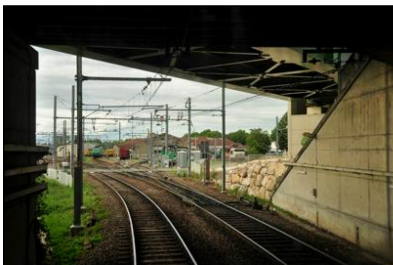
L'entrée prise de l'intérieur