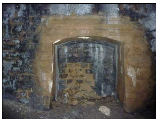
Deux niches du tunnel qui révèlent le mauvais vieillissement de celui-ci : infiltrations calcifiantes et dégradation des piédroits

Si cette fiche comporte des erreurs ou des oublis, merci de nous le signaler.