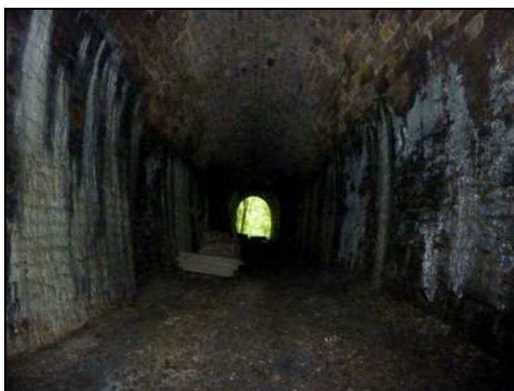
Vue de la galerie révélant les importantes coulées d'eau