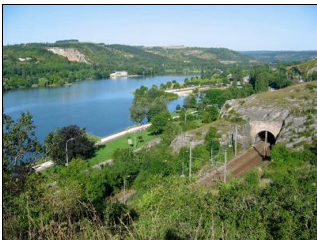
Autre vue de la sortie du tunnel de Dijon 1 à côté du beau lac du Chanoine Kir

Si cette fiche comporte des erreurs ou des oublis, merci de nous le signaler.