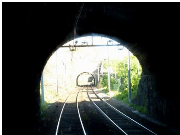
A l'arrière-plan, le tunnel de Dijon 2