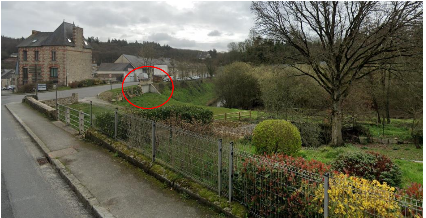
Entrée du tunnel aujourd'hui bouchée