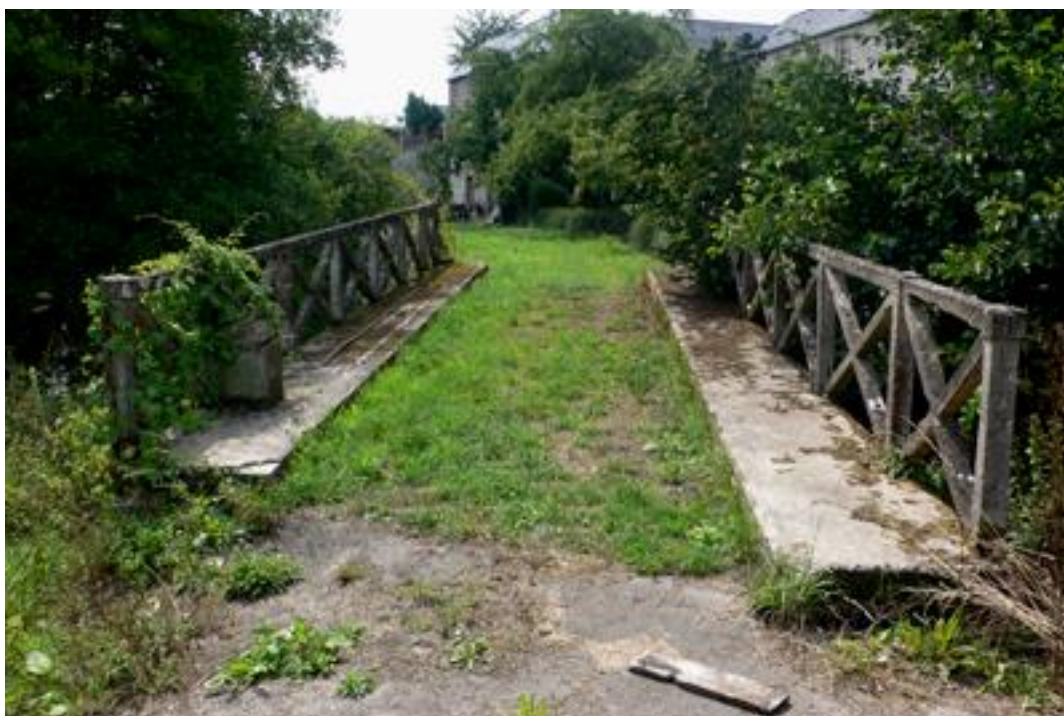
Petit pont juste avant l'entrée dans le tunnel qui témoigne du passage de la voie ferrée

Si cette fiche comporte des erreurs ou des oublis, merci de nous le signaler.