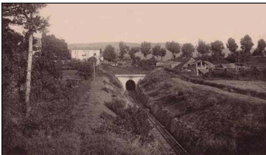
Ci-dessus et ci-dessous, l'entrée hier et aujourd'hui