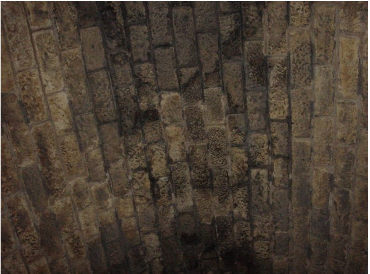
La voûte parfaitement conservée (08/05/2011)