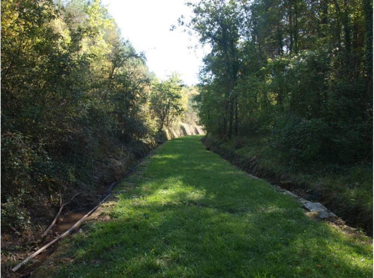
Tranchée qui suit la sortie du tunnel, vue en direction du tunnel (Octobre 2023)