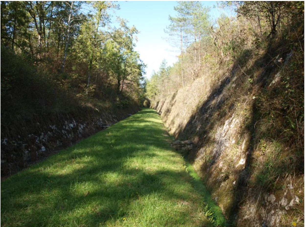
Tranchée qui suit la sortie du tunnel, vue en direction de Ribérac (Octobre 2023)