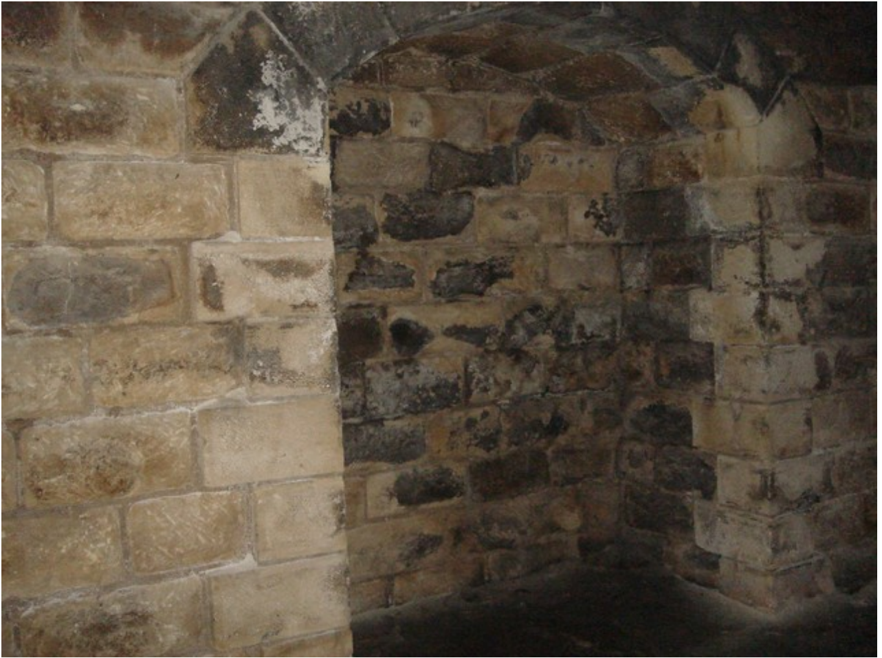
Détail d'une niche (08/05/2011)