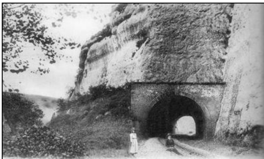
Photo ancienne de l'entrée

Si cette fiche comporte des erreurs ou des oublis, merci de nous le signaler.