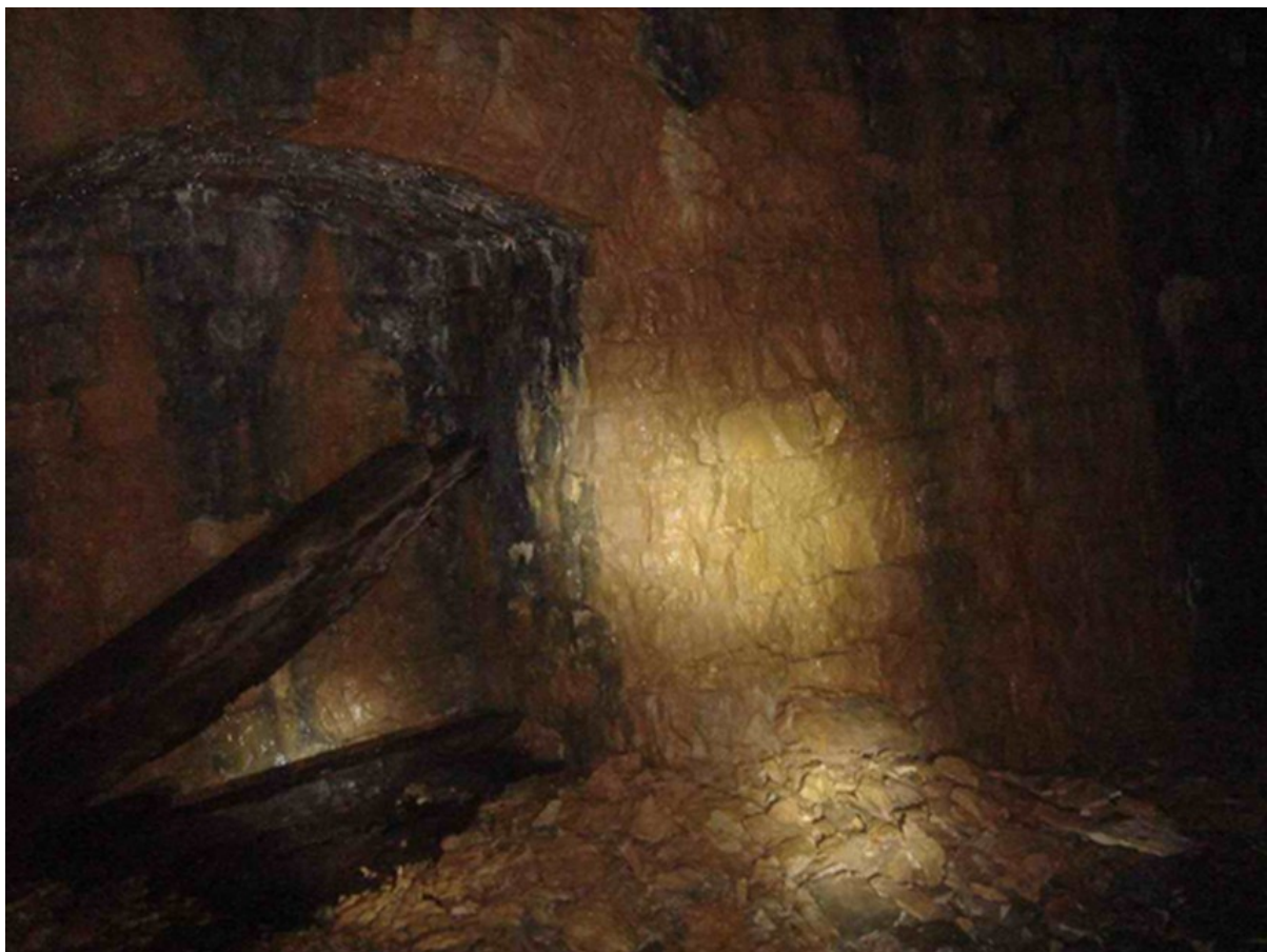
Éclatement de pierres au niveau du piédroit (06/06/2016)