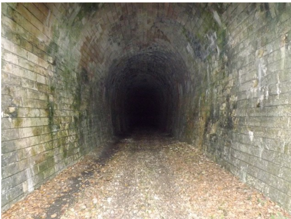
Vue depuis la sortie (photo non datée)