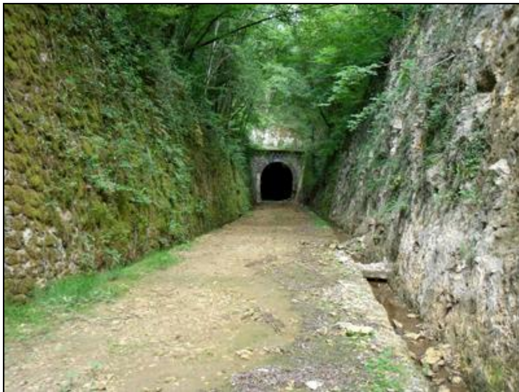
L'entrée du tunnel au bout de sa longue tranchée d'accès

Si cette fiche comporte des erreurs ou des oublis, merci de nous le signaler.