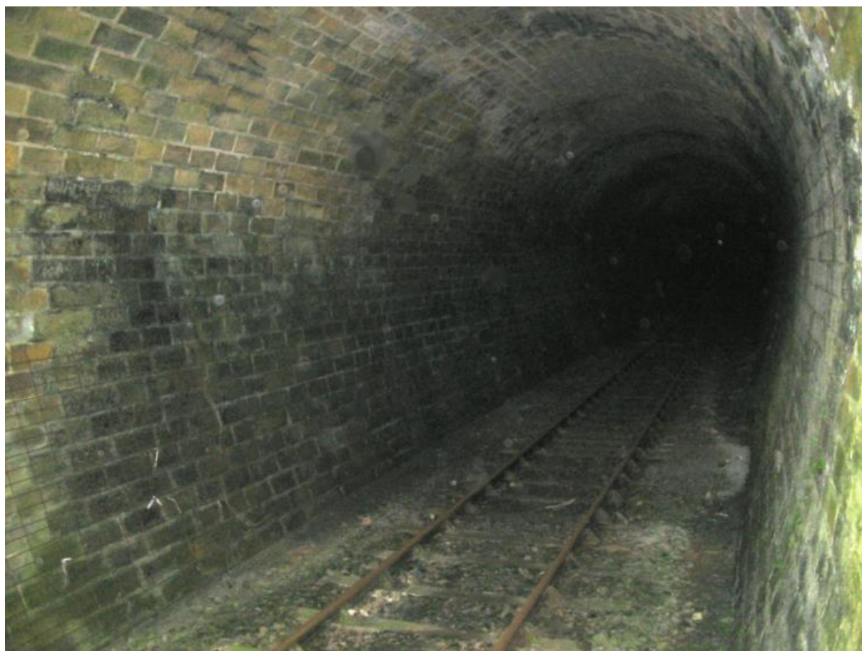
La galerie conservée dans son état initial