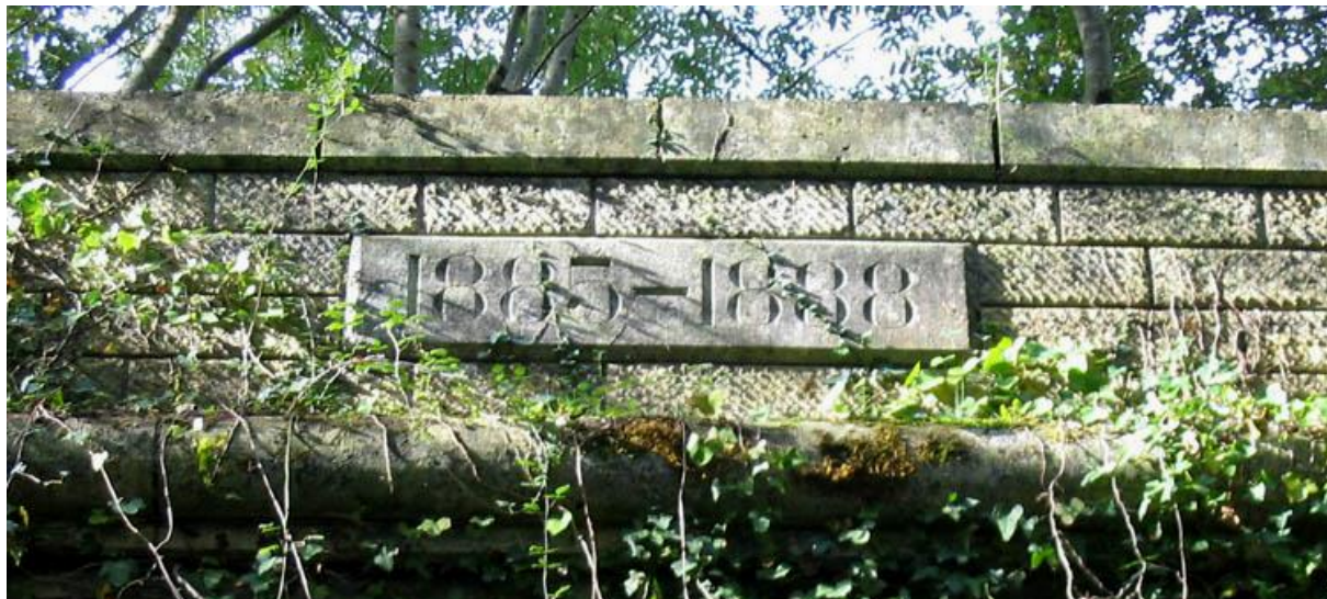
Date de construction sur le fronton