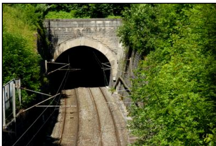
Deux autres vues de l'entrée