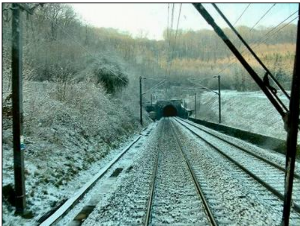
La sortie en hiver