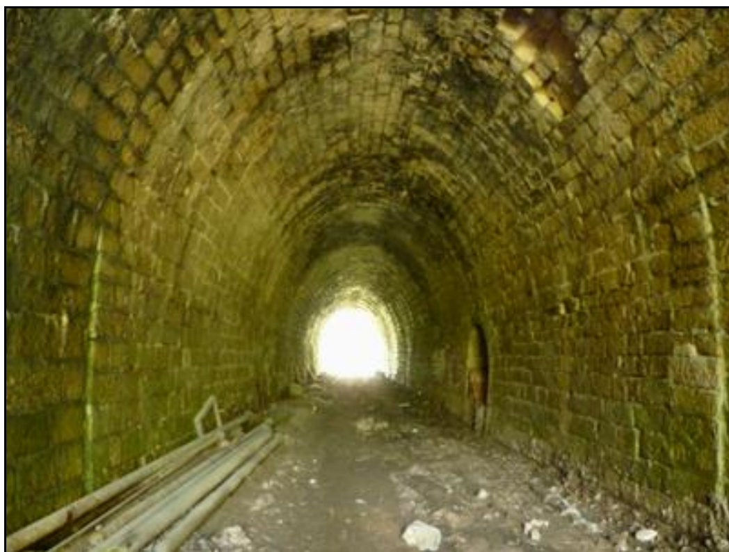
La galerie dont le parement est dans un état très moyen

Si cette fiche comporte des erreurs ou des oublis, merci de nous le signaler.