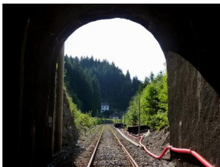
L'entrée vue de l'intérieur

Si cette fiche comporte des erreurs ou des oublis, merci de nous le signaler.