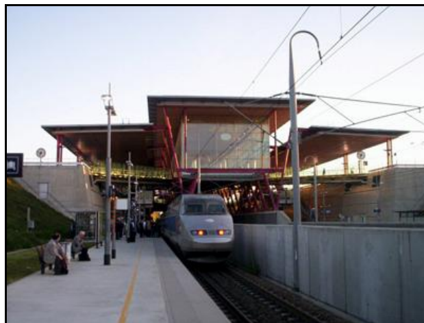
Et TGV à quai sur une voie latérale Les voies rapides sont derrière le muret à droite du train