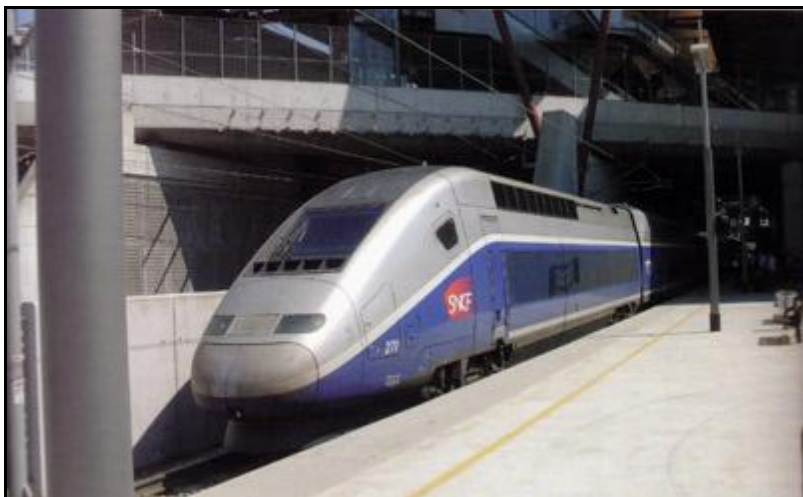
TGV à quai sur voie latérale ouest