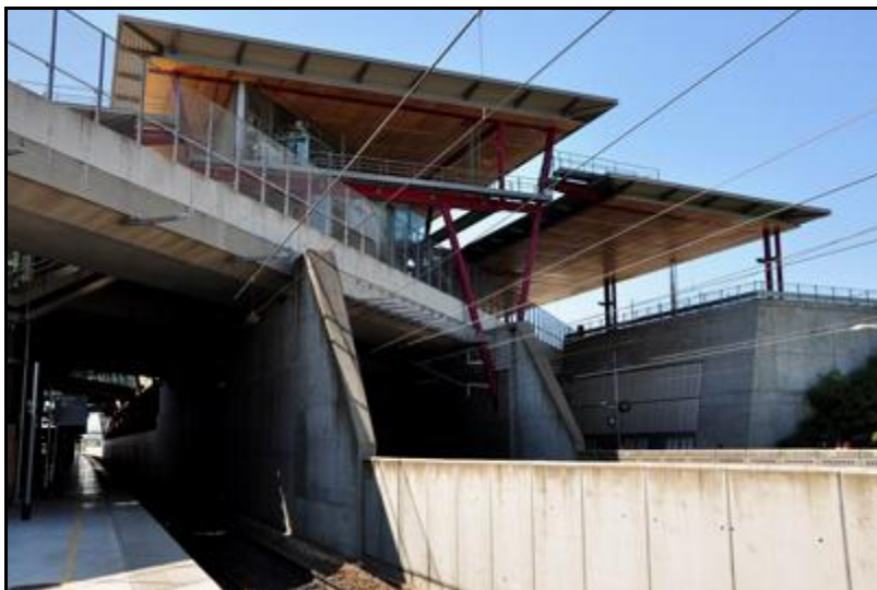
Gros plan sur l'entrée prise au niveau de la voie latérale est