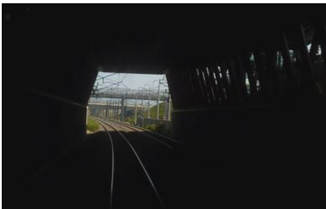
Traversée de la fausse galerie centrale