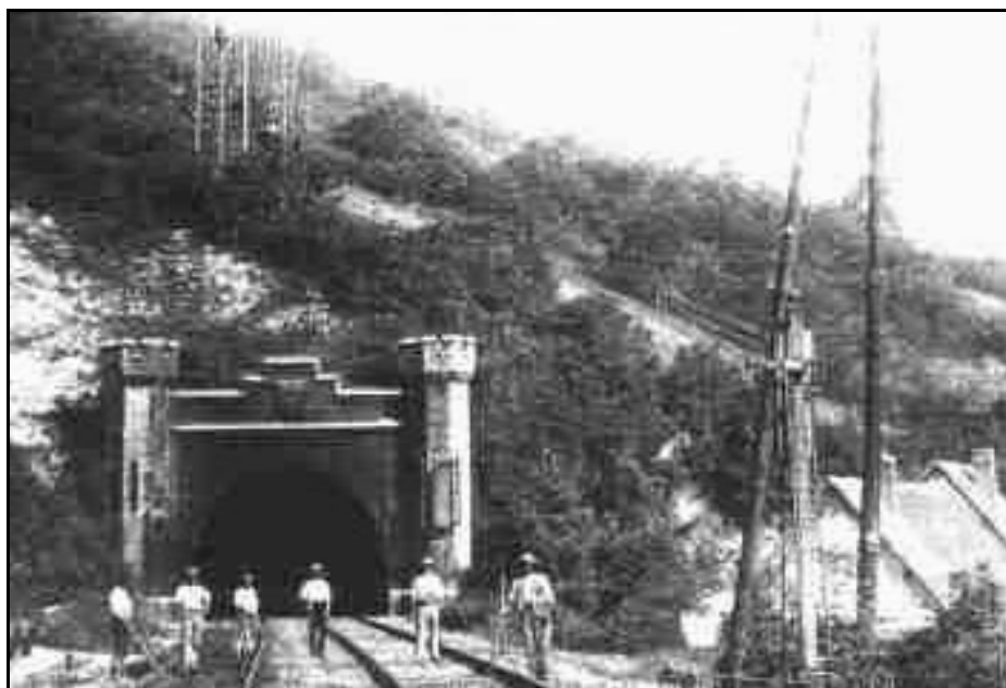
Photo ancienne de l'entrée avec son fronton façon château fort