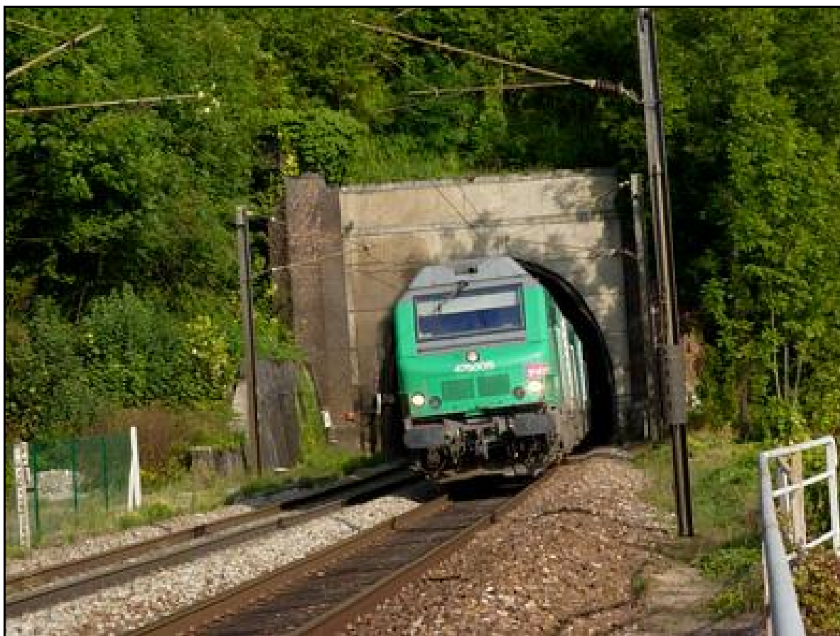
Photo actuelle de l'entrée en partie refaite mais dont les deux tours subsistent toujours

Si cette fiche comporte des erreurs ou des oublis, merci de nous le signaler.