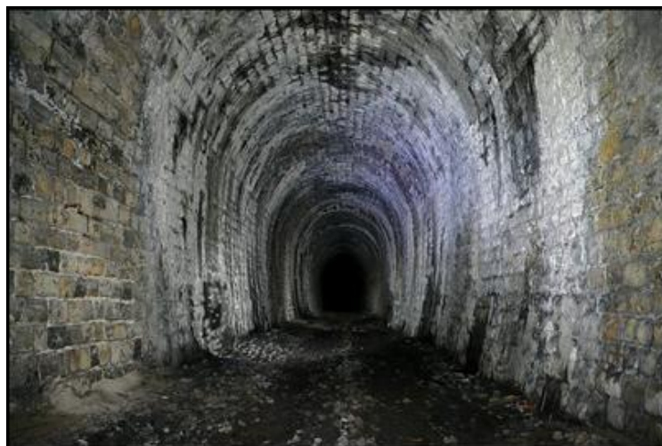
Ci-dessus et ci-dessous, une belle galerie