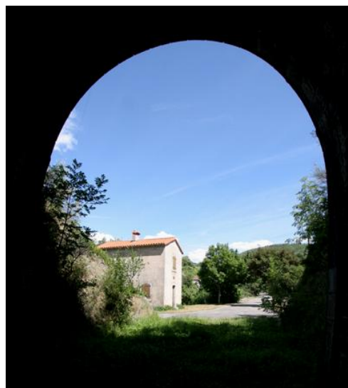
La sortie vue de l'intérieur