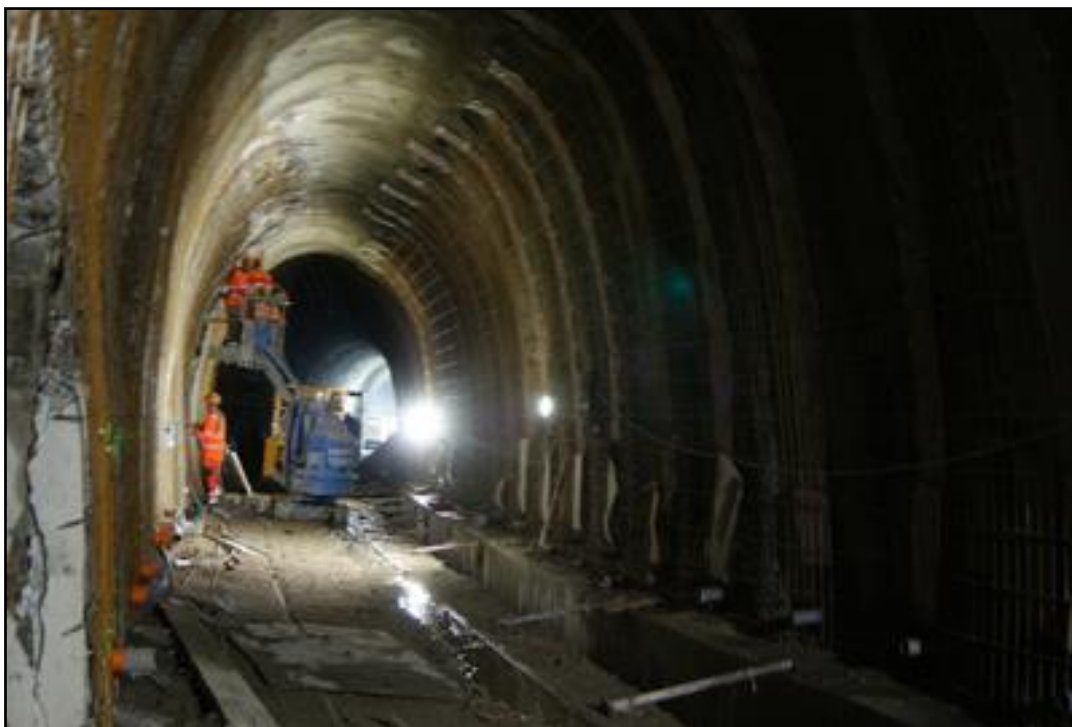
Après rescindement de la voûte, pose des ferrallages qui vont recevoir la coque béton Noter aussi la réfection du drain d'écoulement des eaux dans le radier