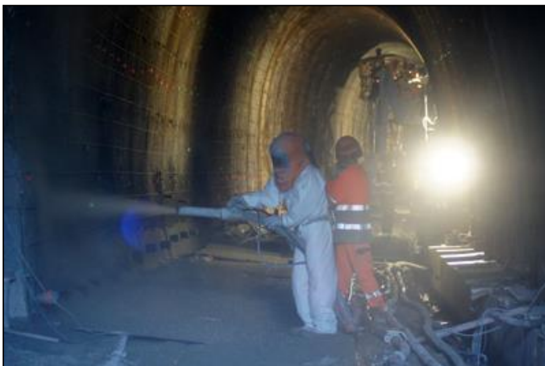
Belle photo d'ambiance qui montre les conditions de travail et la projection de la coque béton

Si cette fiche comporte des erreurs ou des oublis, merci de nous le signaler.