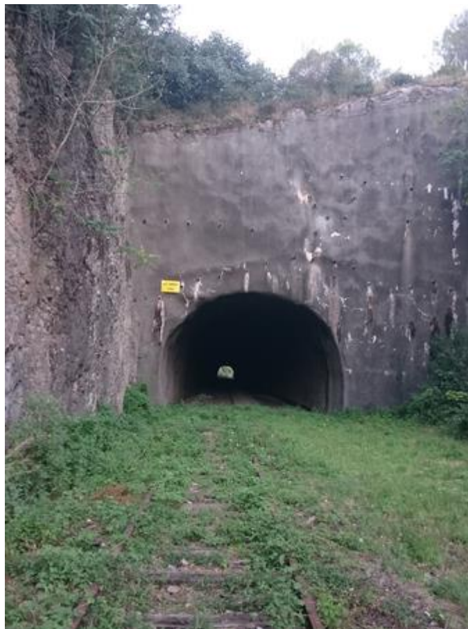
L'entrée du tunnel le 23/08/2016, 4 ans après la fermeture de la ligne.