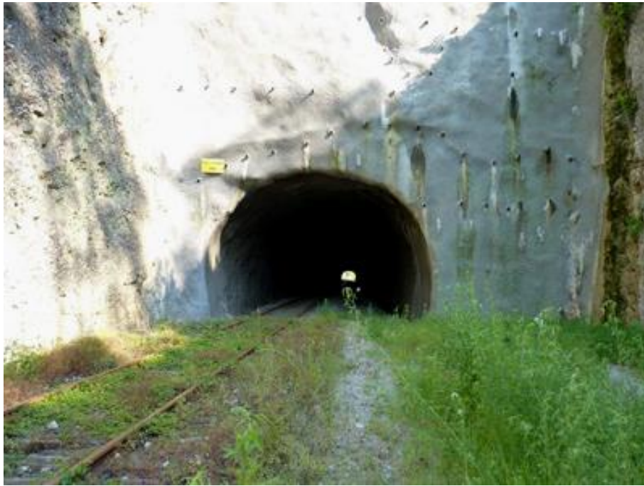
L'entrée du tunnel lorsque la ligne était encore ouverte.