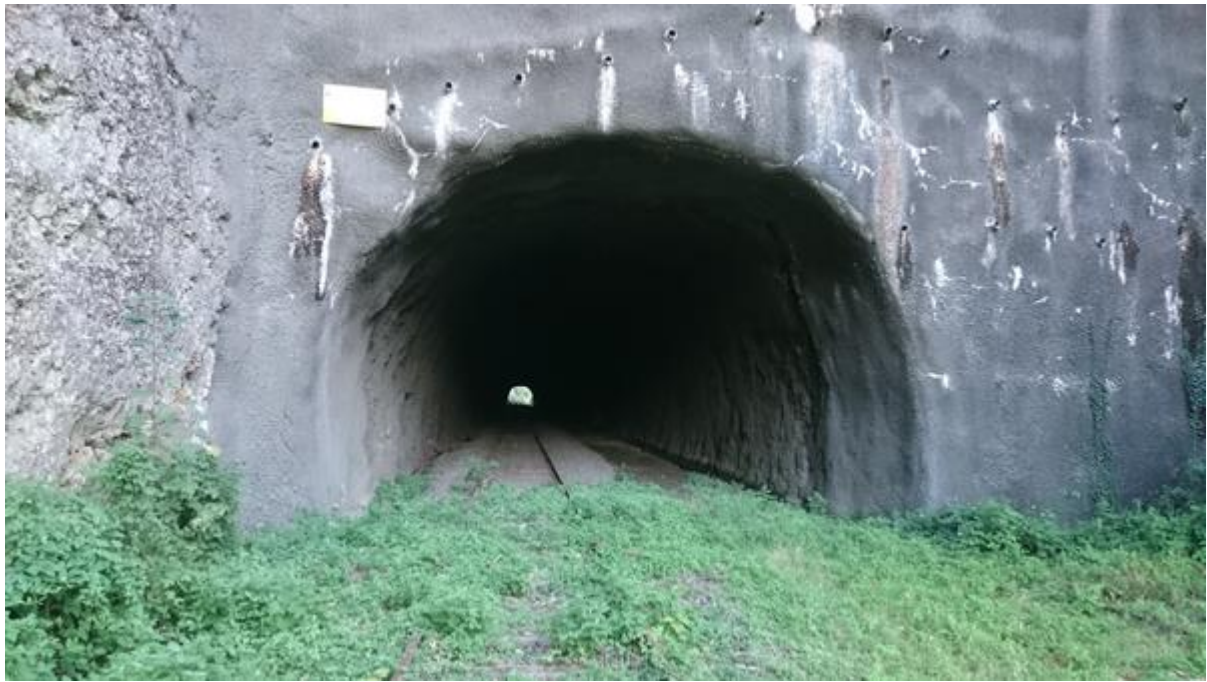
L'entrée du tunnel le 23/08/2016, 4 ans après la fermeture de la ligne.