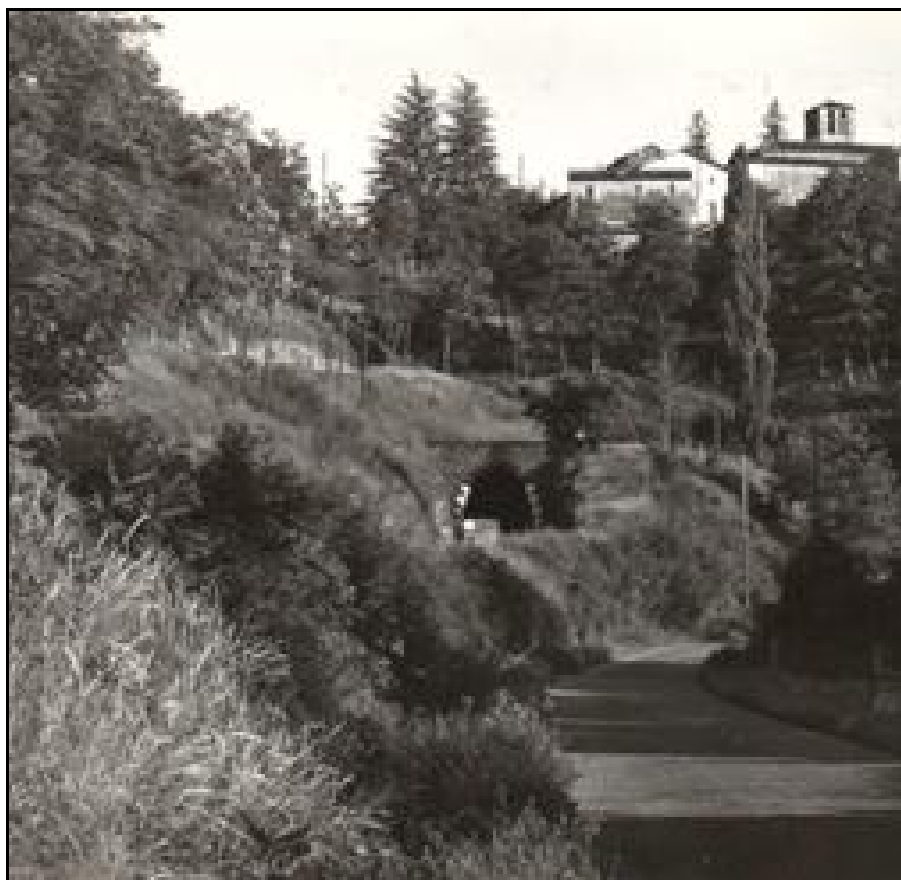
Photo ancienne de l'entrée du tunnel

Quelqu'un a pris mon visage. Qui prendra mon derrière ?