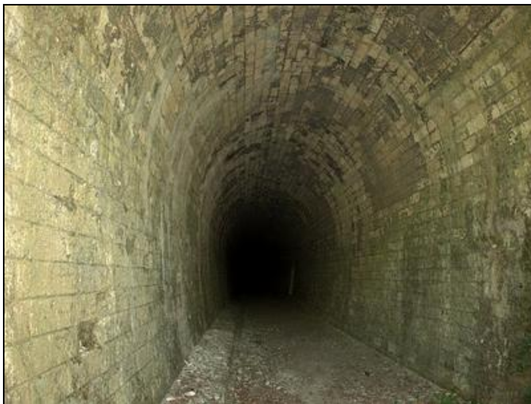
La galerie et son drain d'évacuation d'eau latéral