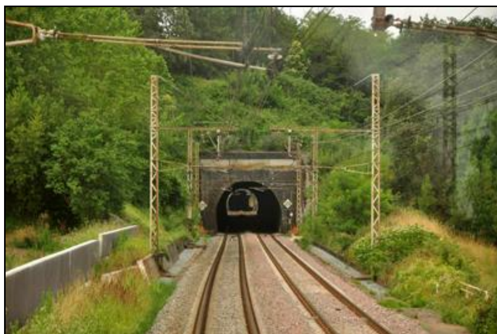
L'entrée de Lormont 1 avec, à l'arrière-plan, celle de Lormont 2