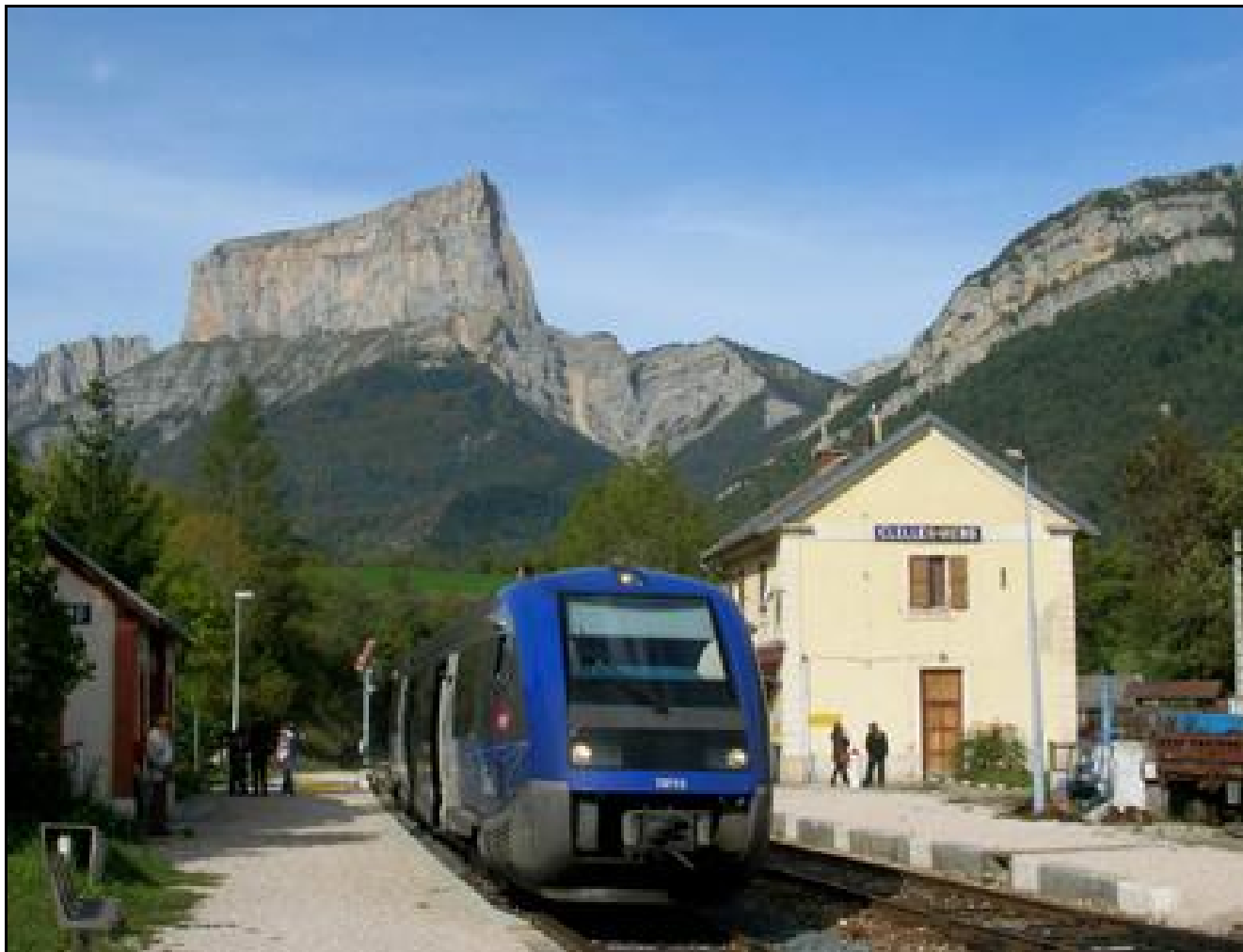
La gare de Clelles Mens sous le Mont Aiguille

Si vous pouvez nous apporter des détails complémentaires, ou si cette notice comporte des erreurs, merci de nous le signaler.