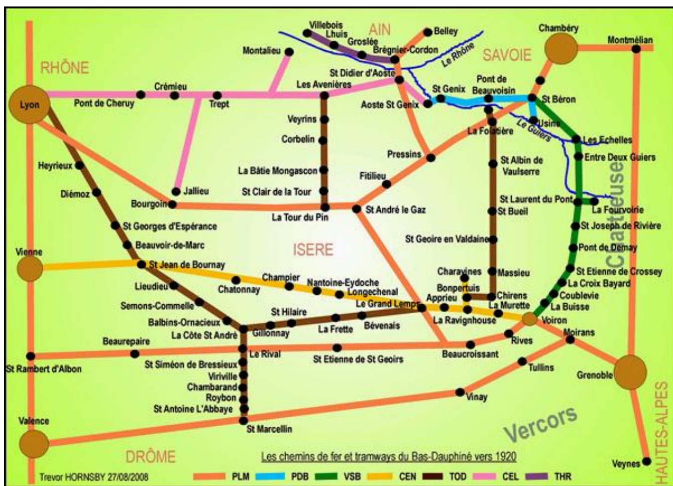
Le réseau des tramways ruraux isérois

De ce fait, le département présentait un réseau ferroviaire important, très diversifié, dont la plus grosse partie a hélas disparu.