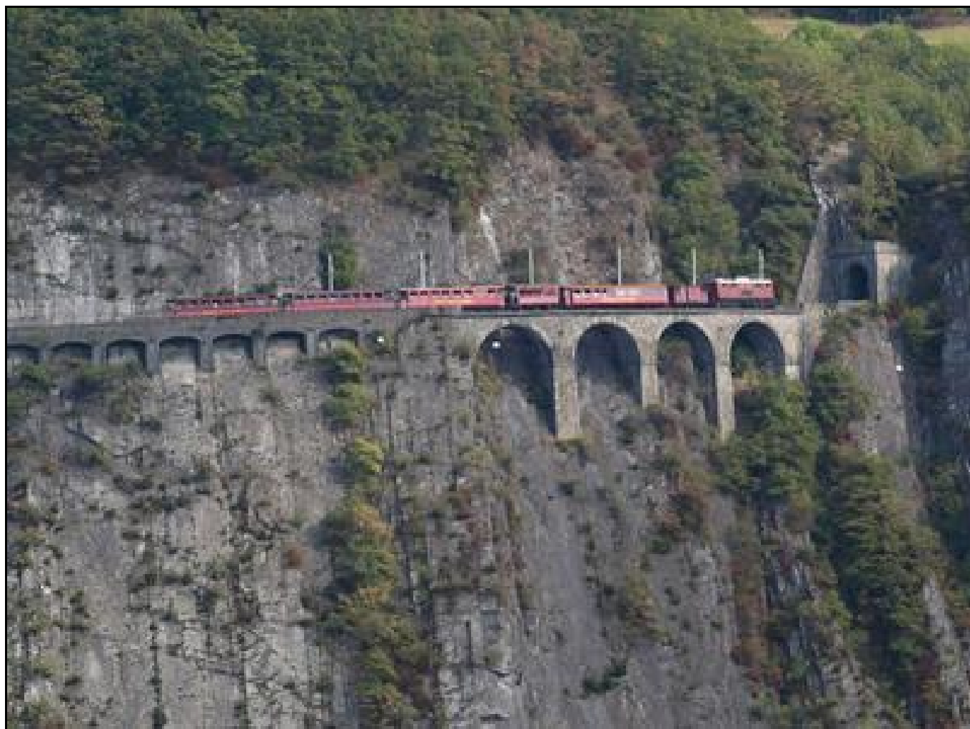
Ci-dessus et ci-dessous, le train touristique dans la falaise des Rivoires