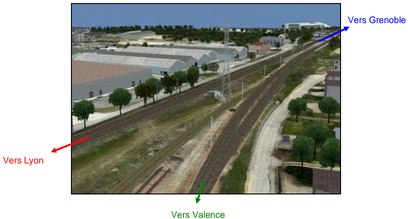
Les lieux dans leur état initial