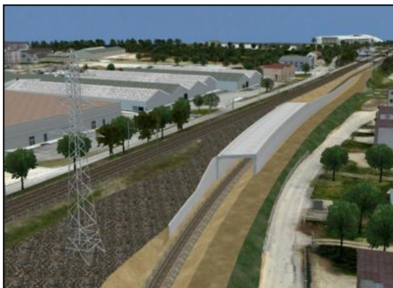
Ci-dessus et ci-dessous, la construction de la galerie