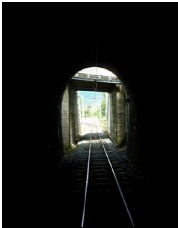
L'entrée du tunnel précédée par un pont routier