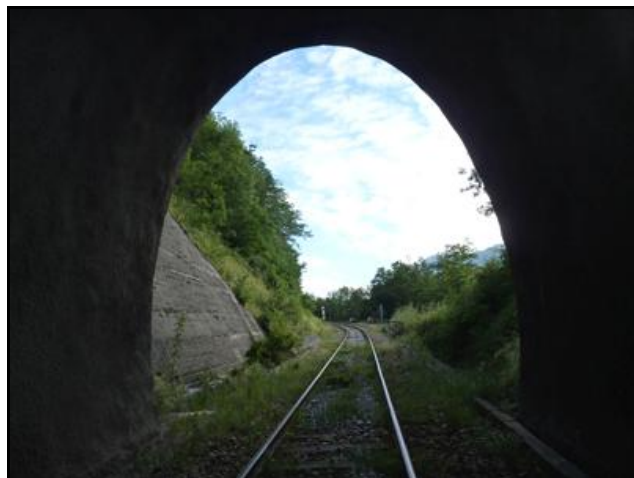
Au fond, la sortie du tunnel de La Motte Sinard n° 1

Si cette fiche comporte des erreurs ou des oublis, merci de nous le signaler.