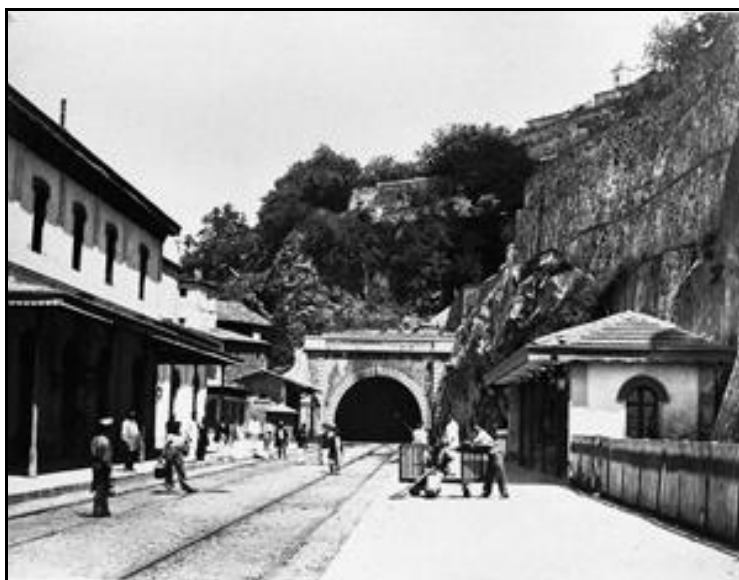
Ci-contre, vue ancienne de la sortie du tunnel du temps de la vapeur

Si cette fiche comporte des erreurs ou des oublis, merci de nous le signaler.