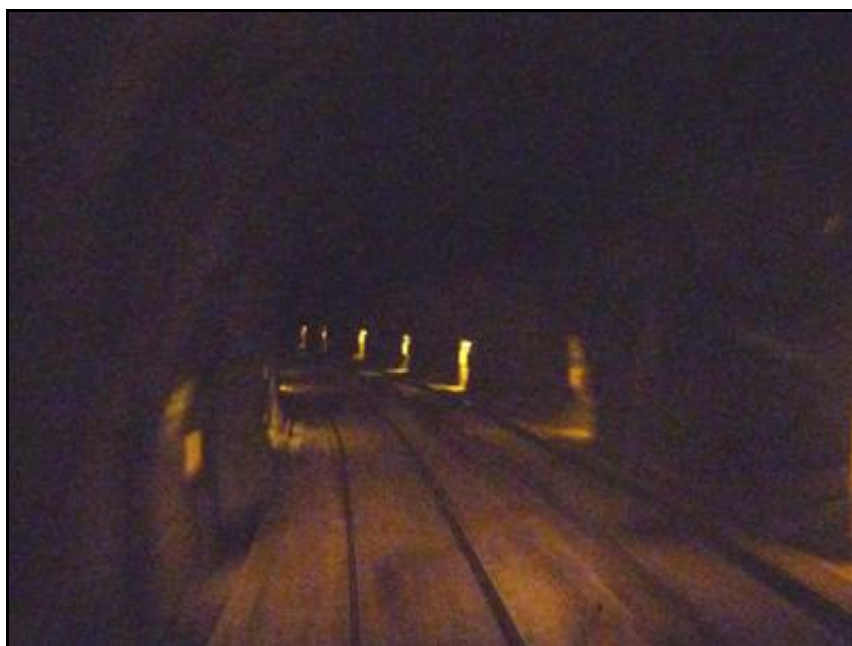
Dans la galerie