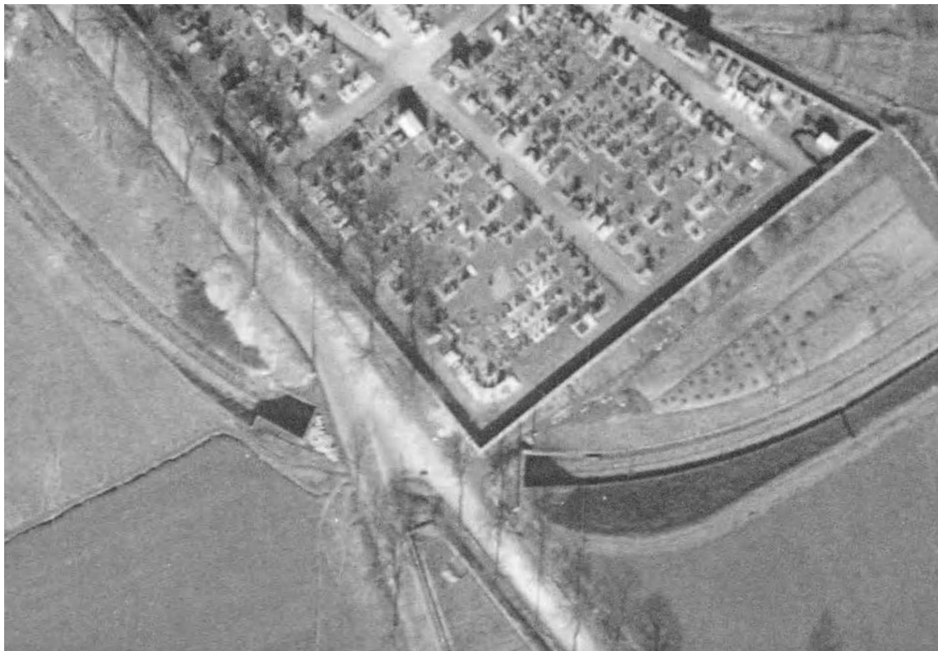
Vue aérienne du 05/03/1948 où l'on distingue nettement le tunnel

Ce tunnel situé sur l'ancienne ligne métrique Clairvaux > Saint Laurent appartient aujourd'hui à un particulier qui l'a fermé. Sa sortie a été comblée lors d'une extension du cimetière de Clairvaux sous lequel il passe. Elle n'est donc plus visible.