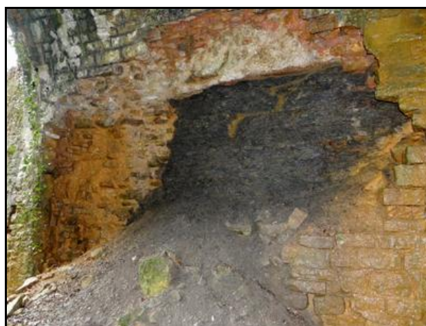
Décrochements de voûte et piédroits effondrés