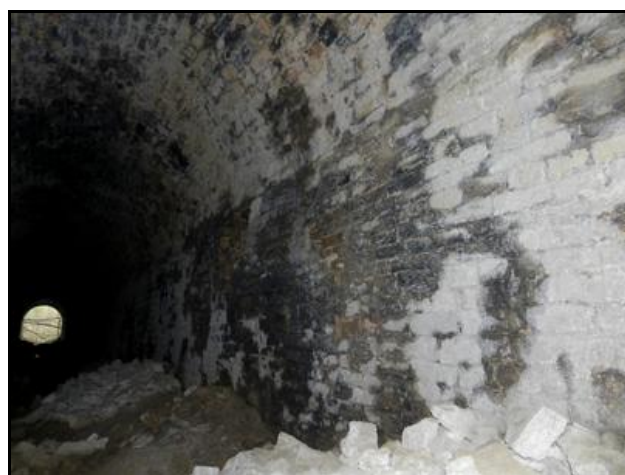
Ci-dessus et ci-dessous, diverses vues du triste état de la galerie