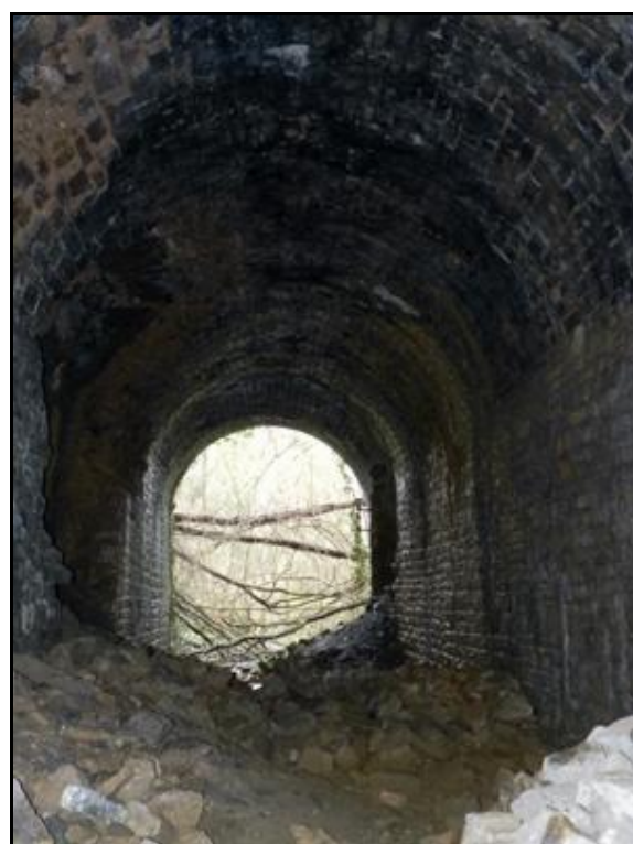
L'entrée et la sortie, vues de l'intérieur de la galerie